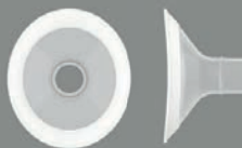
2 st PersonalFit Flex™ brösttrattar 24 mm