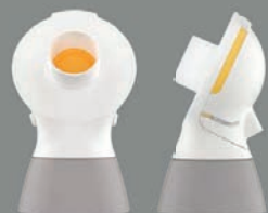
2 st PersonalFit Flex™ anslutningsenheter