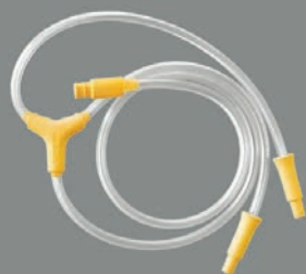
1 st slang