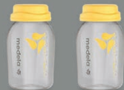
2 st 150 ml-bröstmjölks- flaskor med lock