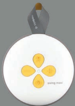
1 st Swing Maxi™ motorenhet